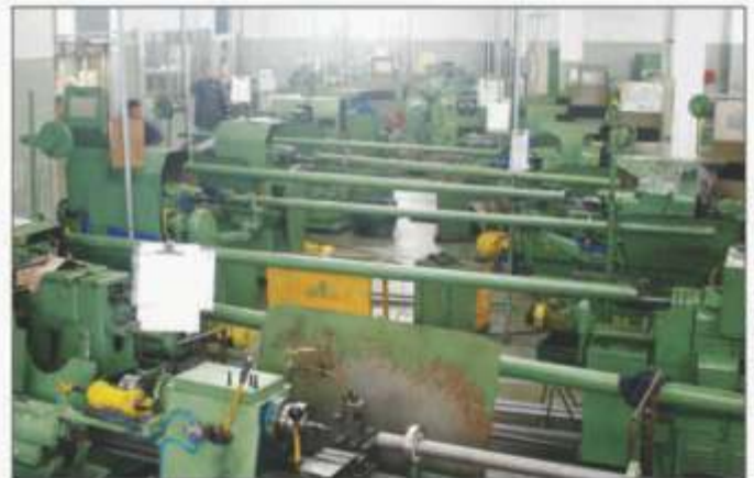
Impressão: Brasil Soluções Gráficas